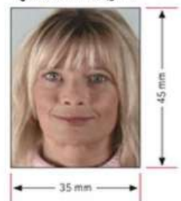
รูปถ่ายมาตรฐาน