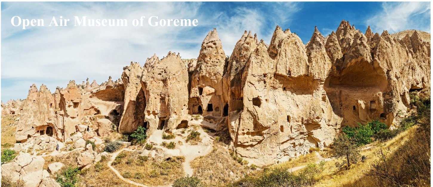
Open Air Museum of Goreme

นำท่านเดินทางสู่ พิพิธภัณฑสถานกลางแจ้ง เกอราเม่ (Open Air Museum of Goreme) ซึ่งองค์การยูเนสโก ได้ขึ้นทะเบียนพิพิธภัณฑสถานกลางแจ้งแห่งนี้ ให้เป็นมรดกโลก ซึ่งเป็นศูนย์กลางของศาสนาคริสต์ในช่วง ค.ศ. 9 ซึ่งเป็นความคิดของชาวคริสต์ที่ต้องการเผยแพร่ศาสนาโดยการขุดถ้ำเป็นจำนวนมากเพื่อสร้างโบสถ์ และยังเป็นการป้องกันการรุกรานของชนเผ่าลัทธิอื่นที่ไม่เห็นด้วยกับศาสนาคริสต์