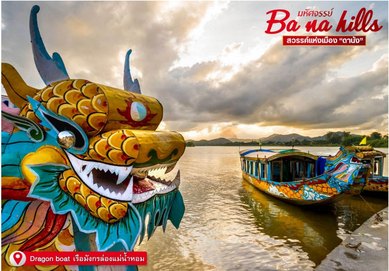
Dragon boat เรือมังกรล่องแม่น้ำหอม

นำท่าน ลงเรือมังกรล่องแม่น้ำหอม พร้อมชมการแสดงและดนตรีพื้นเมือง