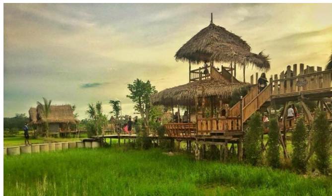
กลางวัน รับประทานอาหารกลางวัน ณ ร้านอาหาร

บ่าย นำท่านแวะถ่ายรูปกับ เขากทะเล เป็นภูเขาที่ตั้งตระหง่านอยู่บริเวณใจกลางเมืองพัทลุงมีพื้นที่ครอบคลุมถึง 3 ตำบล ได้แก่ ตำบลคูหาสวรรค์ ตำบลปรางค์หมู และตำบลพญาขัน เขากทะเลมีลักษณะเป็นเขาหินปูน สูงประมาณ 250 เมตร บริเวณตรงกลางเกือบถึงตอนปลายของยอดเขา มีโพรงขนาดใหญ่ขนาดเส้นผ่าน ศูนย์กลางราว 10 เมตรที่สามารถมองทะเลไปยังอีกด้านหนึ่งได้