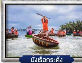
นึ่งเรือกระด้าง