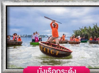
นั่งเรือกระด้ง