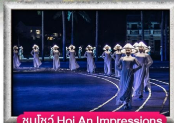
ชมโชว์ Hoi An Impressions

เมนู สุดพิเศษ Premium Seafood, Buffet Bana Hills