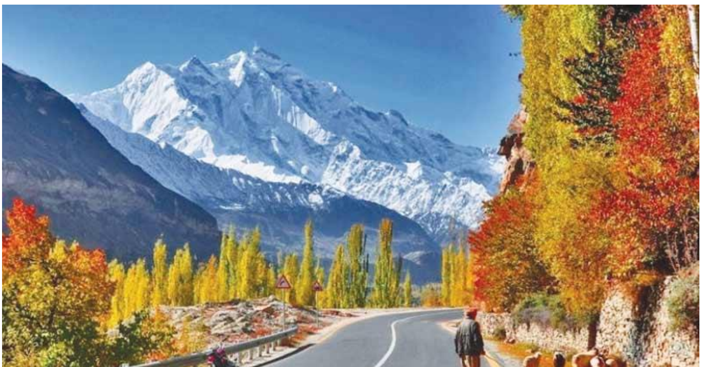
นำท่านสู่ เมืองกิลกิต (Gilgit)

กลางวัน รับประทานอาหารกลางวัน ณ ภัตตาคาร