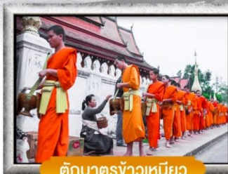
ตักบาตรข้าวเหนียว