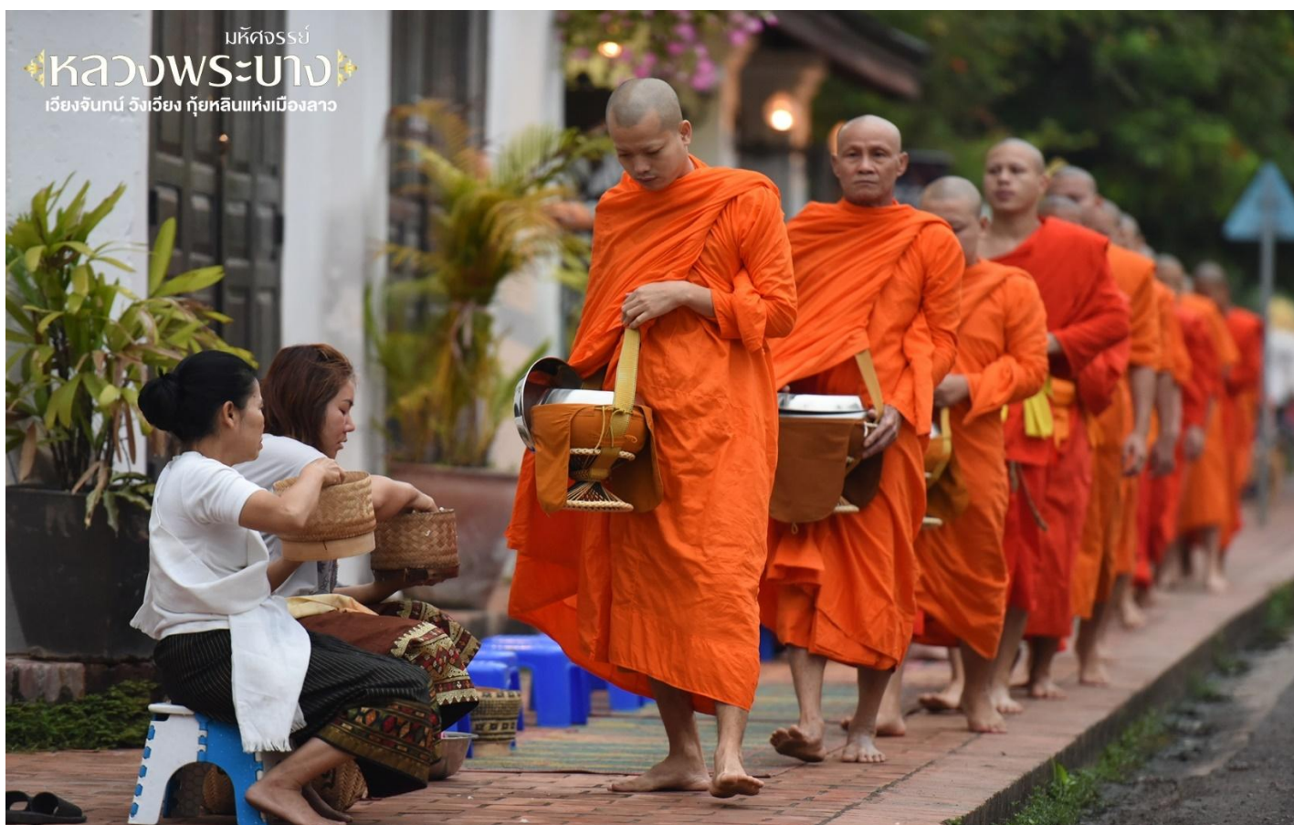
มหัศจรรย์ หลวงพระบาง เวียงจันทน์ วิงเวียง กุ้ยหลินแห่งเมืองลาว