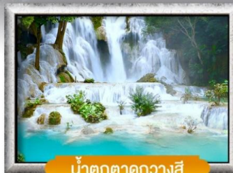
น้ำตกตาดควางสี