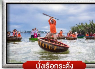
นึ่งเรือกระดัง