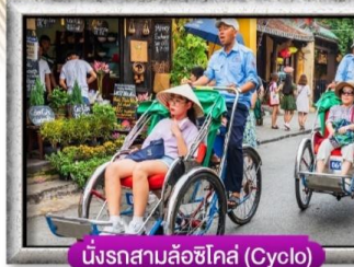
นั่งรถสามล้อซีโคล (Cyclo)