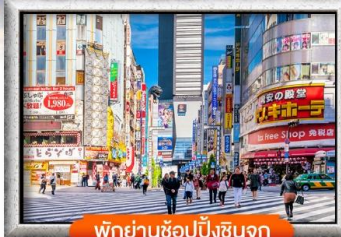
พิกย่านช้อปปิ้งชินจูกุ