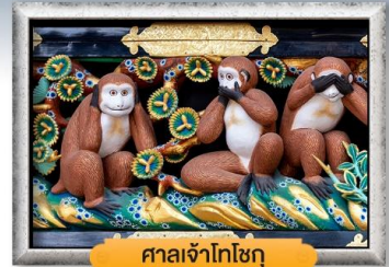
ศาลเจ้าโทโชกุ

พิเศษฟรี! ซิมโทรศัพท์ 1 ฟอง, แช่น้ำแร่ออนเซ็น