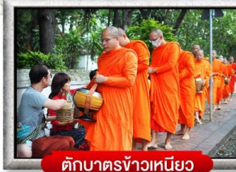
ตักบาตรข้าวเหนียว