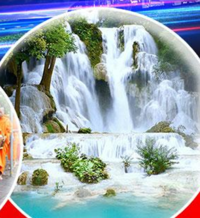
น้ำตกตาดกวางสี