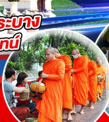
ตักบาตรข้าวเหนียว