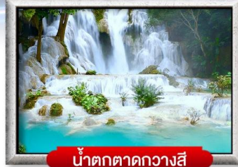
น้ำตกตาดขวางสี