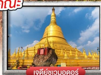
เจดีย์ชเวดากอง

เมนู สุดพิเศษ | กุ้งแม่น้ำเผา + บุฟเฟ่ต์นานาชาติ