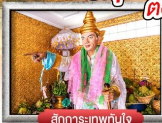
สักการะเทพทันใจ