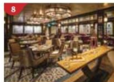
Bistro By Mark Best Relish contemporary Western cuisine from the internationally-acclaimed Australian chef.