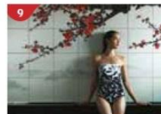
Crystal Life™ Spa Rejuvenate mind, body and soul with our holistic Western and Asian spa experience.