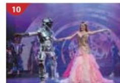
Zodiac Theatre Enjoy live production shows from the acclaimed award-winning entertainment team.

ค่า รับประทานอาหารค่าตามห้องอาหารที่ทางเรือจัดให้ หลังจากนั้น ท่านสามารถรับชมการแสดงที่ห้องโชว์หลัก(กรุณาสารองที่นั่งล่วงหน้า) หรือดนตรีสดตามบาร์ต่างๆทั่วทั้งลำเรือ หลังจากนั้นพักผ่อนตามอัธยาศัย