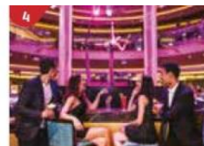
Bar 360 Catch live music and aerial acrobatic performances with a glass of champagne.