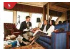
The Palace Indulge in European-style butler service and exclusive facilities.