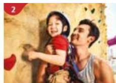
Rock Climbing Wall Challenge yourself on our mountainous rock climbing wall.