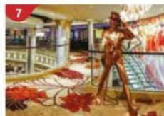
Johnnie Walker House™ Immerse yourself in the intricate world of premium Scotch whisky.