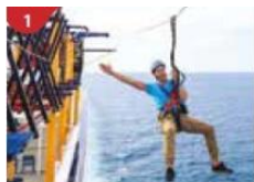
Ropes Course & Zipline Feel the thrill of gliding above the ocean on a 35-metre zipline.