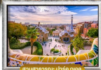
สวนสาธารณะ: ปาร์ค กูเอล

ลึ้มสหมูหัน ที่ Sobrino de Botín + ข้าวผัดสเปน