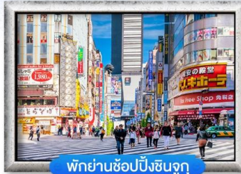
พิกย่านช้อปปิ้งชินจูกุ