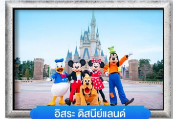
อิสระ ดิสนีย์แลนด์

พิเศษ! สุกียากี สโตล์ญี่ปุ่น, บุฟเฟ่ต์งาปูยักษ์