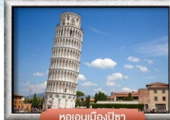
หอเอนเมืองปิซา

พิเศษ! สปาเกตตี้เส้นหมึกดำ, พิชซ่าสโตร์อิตาเลียนแท้