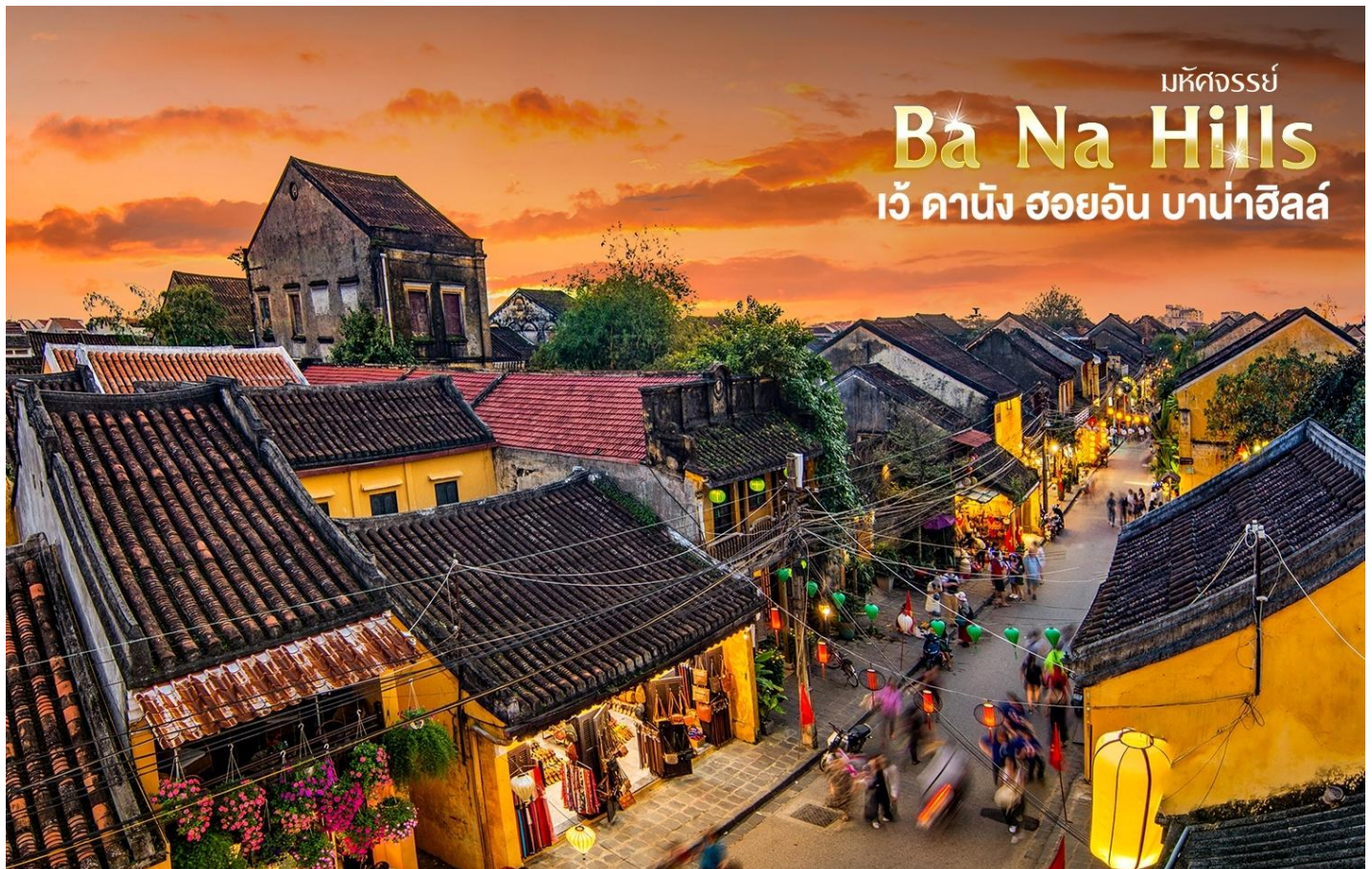
มหัศจรรย์ Ba Na Hills เว้ ดานัง ฮอยอัน บาน่าฮิลล์

นำท่านเดินทางสู่ "เมืองโบราณฮอยอัน" เมืองฮอยอันนั้นอดีตเคยเป็นเมืองท่า การค้าที่สำคัญแห่งหนึ่งในเอเชียตะวันออกเฉียงใต้และเป็นศูนย์กลางของการแลกเปลี่ยนวัฒนธรรมระหว่างตะวันตกกับตะวันออกองค์การยูเนสโกได้ประกาศให้ฮอยอันเป็น เมืองมรดกโลกทางวัฒนธรรม เนื่องจากเป็นสถานที่สำคัญทางประวัติศาสตร์ แม้ว่าจะผ่านการบูรณะขึ้นเรื่อยๆ แต่ก็ยังคงรูปแบบของเมืองฮอยอันไว้ได้ นำท่านเดินทางด้วยรถโค้ชปรับอากาศเดินทางเข้าสู่ตัวเมืองฮอยอัน