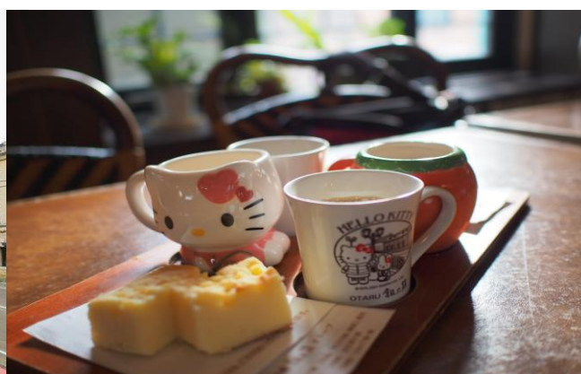
ร้านขนม Le TAO เป็นร้านขนมชื่อดังของเมืองโอตารุ (Otaru) แห่งภูมิภาคฮอกไกโด