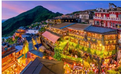
หมู่บ้านโบราณฉิวเฟิ่น