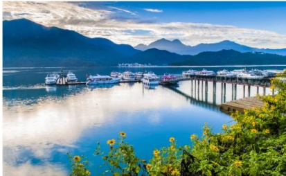
ล่องเรือทะเลสาบสุริยันจันทรา