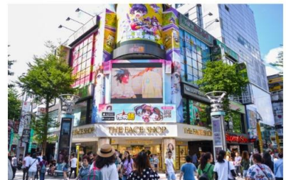
ช้อปปิ้งซีเหมินติง