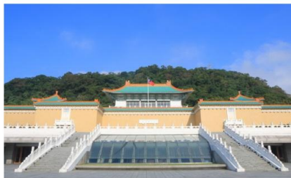
พระราชวังตงทงห้าม