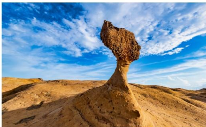
อุทยานเย่หลิว