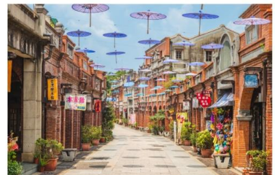
ถนนโบราณซานเซี่ย