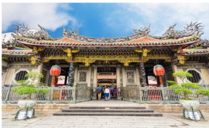
วัดหลงชาน