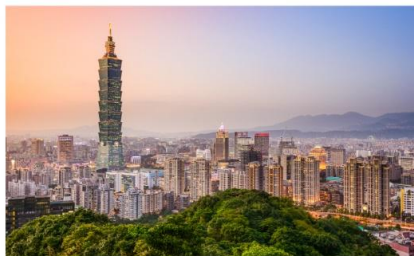
ช้อปปิ้งตึกไทเป101