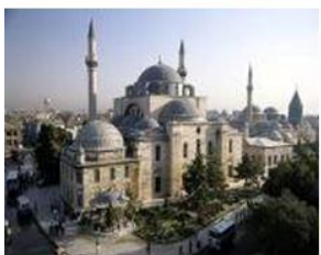
เมืองคอนย่า