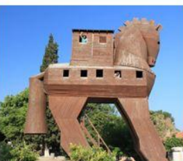
กรุงทรอย