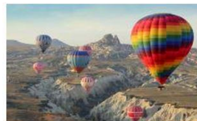
เลือกทำ Option Balloon