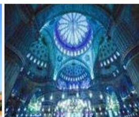
มัสยิดสีน้ำเงิน