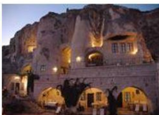
โรงแรมถ้ำ