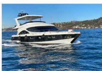
ล่องเรือยอร์ชชมช่องแคบบอสฟอรัส