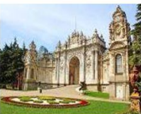
พระราชวังโดลมาบาเช่