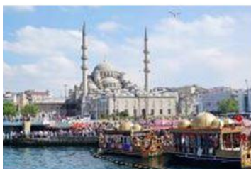
เมืองอิสตันบูล