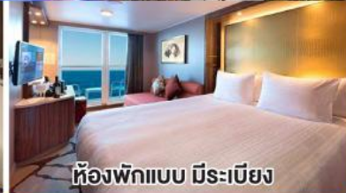
ห้องพักแบบ มีระเบียง

ราคาปกติ 26,900 จ่ายเพียง 24,900 บาท ต่อท่าน