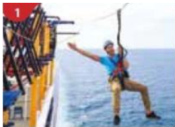
1 Ropes Course & Zipline Feel the thrill of gliding above the ocean on a 35-metre zipline.