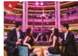
4 Bar 360 Catch live music and aerial acrobatic performances with a glass of champagne.