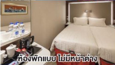
ห้องพักแบบ ไม่มีห้องสูบบุหรี่