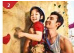
2 Rock Climbing Wall Challenge yourself on our mountainous rock climbing wall.