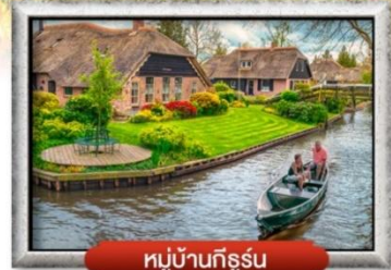
หมู่บ้านทีจอร์น

เมนู พิเศษ! หอยแมลงภู่มื้อกลางวัน, ล่องเรือหลังคากระจก