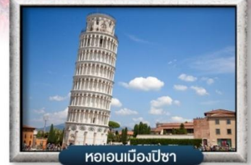
หอเอนเมืองปิซา

พิเศษ! สปาเกตตี้เส้นหมึกดำ, พิชซ่าสโตร์อิตาลีแท้