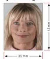
รูปถ่ายมาตรฐาน

*** สถานทูตไม่อนุญาตให้ตั้งเล่มพาสปอร์ต หากได้ยื่นเข้าไปแล้ว ดังนั้นถ้าท่านรู้ว่าต้องใช้เล่มกรุณาแจ้งบริษัททัวร์ฯ เพื่อขอยื่นวีซ่าล่วงหน้าก่อนกรุป และให้แนบตัวเครื่องบินในช่วงที่ท่านจะเดินทางมาด้วย ***