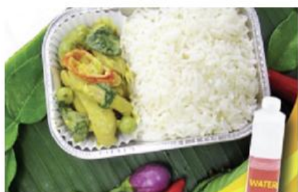
Green curry chicken with rice and water