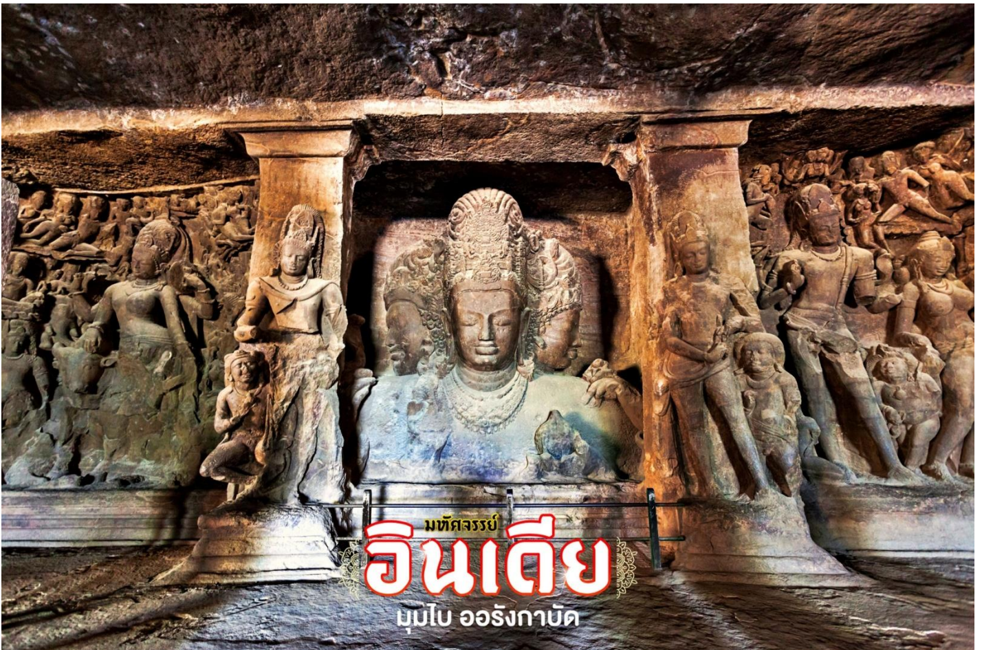
มณฑลจรรยา อินเดีย มัมไบ ออังกาบ

ถ้ำหลัก (Grand Cave / Great Cave) มีขนาด 39.63 เมตร