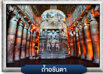
ถ้ำซินตา