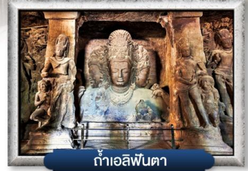
ถ้ำเอลิฟินตา