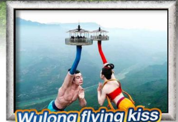
Wulong flying kiss

เมนูพิเศษ! สุกี้หมาล่าวงซึ่ง, เปิดปิกกิ้ง