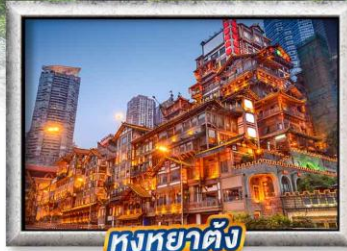
หงหย่าต้ง