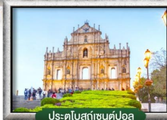
ประตูโบสถ์เซนต์ปอล