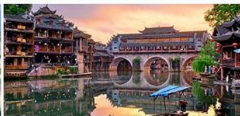
เมืองโบราณเฟิ่งหวง

คุ้มค่า ครบทุกไฮไลท์ ไม่เข้าร้าน พัก 4 ดาว