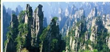
เขาวอดาร (เขาเทียนจื่อซาน)