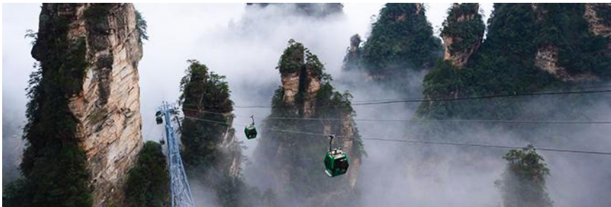
กระเช้าลงจากเขาเทียนจื่อซาน

พักที่ ShanDing PengQuang resort บนเขาฝ่งหยวนเจี๋ยเจี๋ย