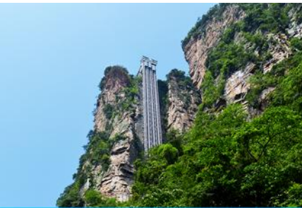
ลิฟท์แก้วไปหลว