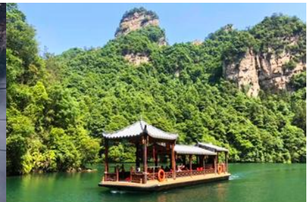
ล่องเรือทะเลสาบ เป่าเฟิงหู

วันที่ห้า ชมพระอาทิตย์ขึ้น-เขาเทียนจื่อซาน(อวตาร) นั่งกระเช้าลงจากเขา-เมืองจางเจี๋ยเจี๋ย – เลือกซื้อ โปรแกรมทัวร์เสริม ออฟชั่น ทะเลสาบเป่าเฟิงหู – เดินทางกลับเมืองหยี่ซัง