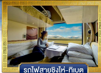
รถไฟสายชิงไห่-ทิเบต