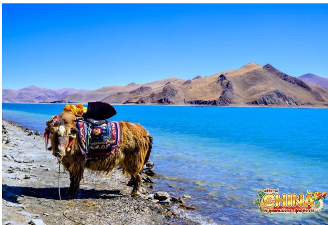
ขนานนามว่า "อัญมณีแห่งทิเบต"

เก็บภาพความประทับใจหนึ่งในสามทะเลสาบศักดิ์สิทธิ์ของชาวทิเบต ทะเลสาบยัมดรก ซึ่งเป็นทะเลสาบน้ำจืดที่ใหญ่ที่สุดในทิเบต ถูกโอบล้อมไปด้วยภูเขาที่ถูกปกคลุมไปด้วยหิมะ และลำธารที่แยกย่อยออกไปสาย ยามทะเลสาบต้องกับแสงแดดที่สาดลงมา ผืนน้ำสีเทอควอยซ์ก็จะเปล่งประกายสวยงาม สร้างความประทับใจแก่ผู้มาเยือน จนได้รับการ