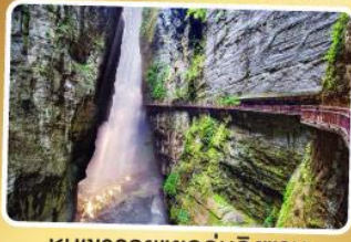
หุบเขารอยแยกอู่หลิงซาน