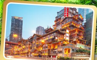
หงหย่าตัง