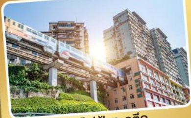
รถไฟฟ้ากะลุดัก