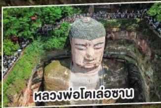
หลวงพ่อโตเล่อซาน