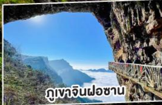
ภูเขาจินฝอซาน