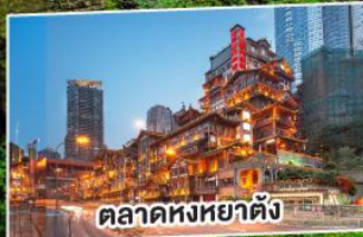
ตลาดหงหยาดัง