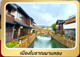
เมืองโบราณผานหลง