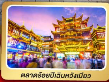
ตลาดร้อยปีเงินหวงเมียว