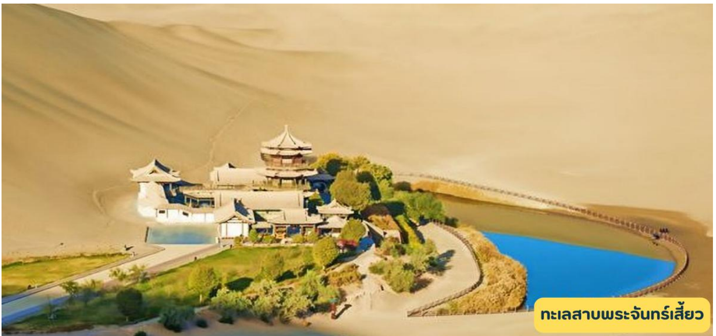
ทะเลสาบพระจันทร์เสี้ยว

วันที่สี่ เมืองเจียอี้กวน - จัตุรัสป้อมปราการ – ดูนหวง - หมิงซาซาน – ทะเลสาบพระจันทร์เสี้ยว