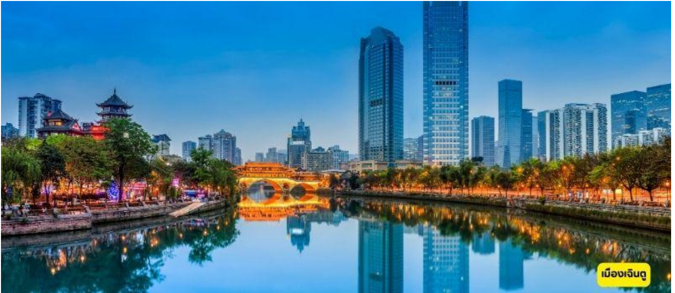
เมืองเฉินตู