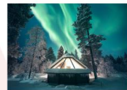
Glass Igloo Hotel

** พักที่ Northern Lights Village 4* หรือเทียบเท่า **