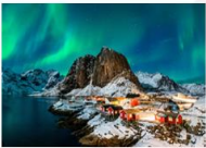
หมู่เกาะโลโฟเทน

xx.xx น. ออกเดินทางสู่เมืองเลกเนส สายการบิน Scandinavian Airline เที่ยวบิน SK4106 (แวะเปลี่ยนเครื่องที่เมือง Bodo) เป็นสายการบิน Wide roe เที่ยวบิน WF810 xx.xx น. เดินทางถึงเมืองเลกเนส