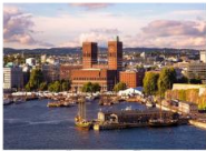
เมืองออสโล

06.10 น. เดินทางถึงสนามบินอิสตันบูล (แวะเปลี่ยนเครื่อง) 09.00 น. ออกเดินทางสู่กรุงออสโล ประเทศนอร์เวย์ เที่ยวบิน TK1751 11.00 น. เดินทางถึงสนามบินเมืองออสโล