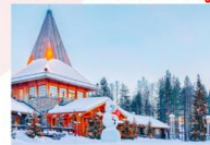
หมู่บ้านซานต้าครอส

15.25 น. ออกเดินทางสู่อิสตันบูล ประเทศตุรกี เที่ยวบิน TK1750 21.10 น. เดินทางถึงสนามบินอิสตันบูล (แวะเปลี่ยนเครื่อง)