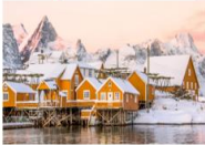
หมู่บ้าน Sakrisoy

** พักที่ Eliassen Rorbuer 4* หรือเทียบเท่า **