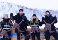
สัมผัสประสบการณ์กับการจับปูยักษ์

xx.xx น. ออกเดินทางสู่เมืองคีร์กเคเนส โดยสายการบิน... เที่ยวบิน... xx.xx น. เดินทางถึงสนามบินเมืองคีร์กเคเนส