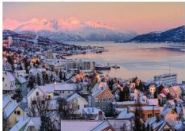
Tromsø Cable Car

** พักที่ Clarion Hotel The Edge 4* หรือเทียบเท่า **