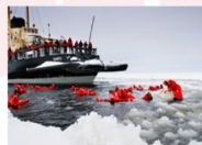
ล่องเรือตัดน้ำแข็ง Ice Breaker

** พักที่ Scandic Kemi 4* หรือเทียบเท่า **