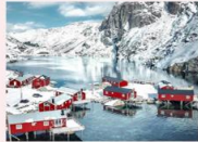
หมู่บ้าน Nusfjord

เพลิดเพลินกับการชมแสงเหนือ (Northern lights) บริเวณรอบโรงแรมที่พัก