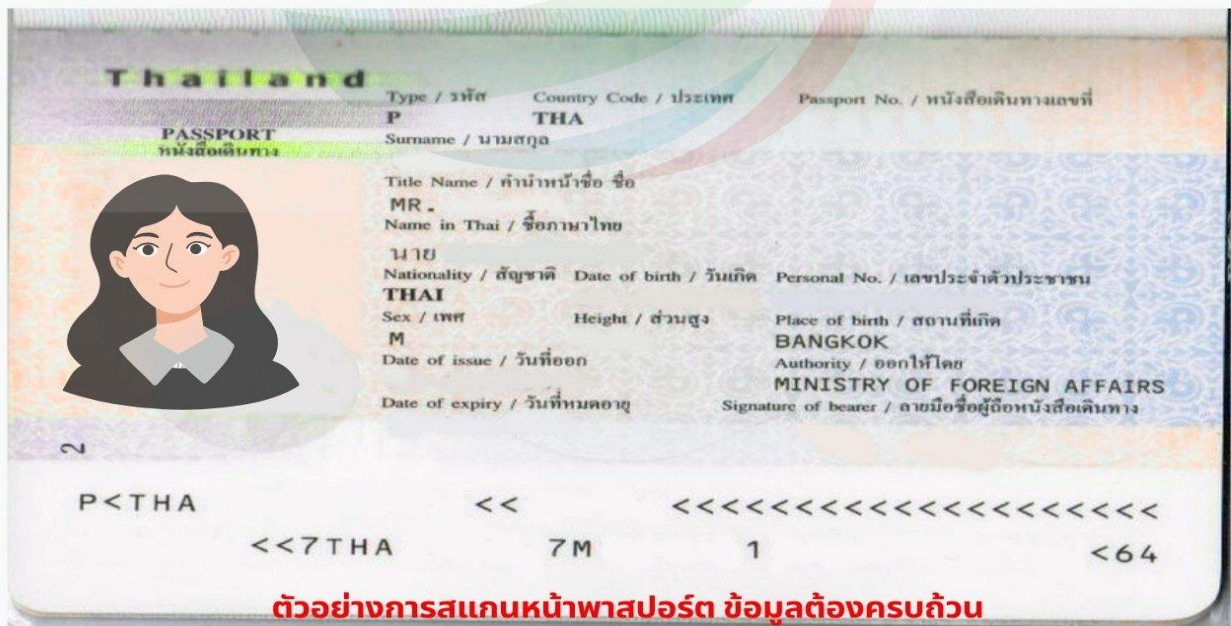
ตัวอย่างการสแกนหน้าพาสปอร์ต ข้อมูลต้องครบถ้วน ท่านสามารถสแกนส่งไฟล์ PDF หรือถ่ายรูปส่งแทนได้ ( รูปไม่เอียง ไม่ติดนิ้ว)

การพิจารณาวีซ่าเป็นดุลยพินิจของทางสถานทูตเท่านั้น ทางบริษัทเป็นผู้ดำเนินการเรื่องเอกสารและ อำนวยความสะดวก ซึ่งสามารถกรอกออนไลน์ได้ก่อนเดินทาง 30 วัน หรือหลังจากท่านชำระเงินงวด สุดท้าย ทั้งนี้หลังจากกรอกข้อมูลเข้าระบบแล้วใช้เวลาพิจารณา 7-15 วันทำการ กรณีวีซ่าท่านล่าช้า หรือถูกปฏิเสธและมีค่าใช้จ่ายเพิ่มเติม ทางบริษัทขอสงวนสิทธิ์เก็บตามค่าใช้จ่ายที่เกิดขึ้นจริง