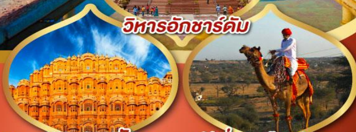
วิหารอักขารัม