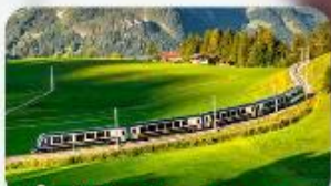
นั่งรถไฟสายโรแมนติก 2 สาย Golden Pass / Luzern Interlaken Express