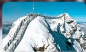
พิชิต 3 ยอดเขาดัง Rigi / Schilthorn / Glacier 3000