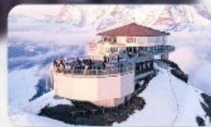
ทานอาหารที่ Piz Gloria ภัตตาคารที่หมุนได้ 360 องศา