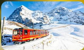
พิชิตยอดเขาจุงเฟรา

พักที่ Pullman Paris Tour Eiffel Hotel พิเศษ !!! ห้องระเบียงวิวหอไอเฟล หรือระดับเทียบเท่า