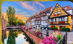
ดินแดนแห่งเทพนิยาย กอลมาร์