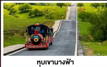
หุบเขานางฟ้า