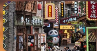
หมู่บ้านสี่ปาที