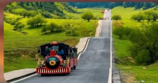
หุบเจนางฟ้า