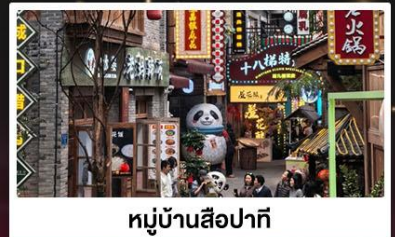
หมู่บ้านสี่牌坊