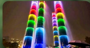
น้ำพุไม้ไฟ