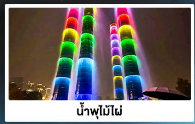
น้ำพุไม้ไฟ