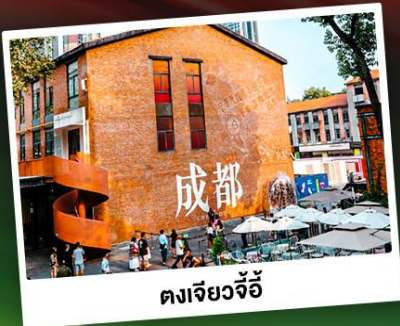
ตงเจียวจี้

เทือกเขาแอลป์แห่งเมืองจีน ชมความงามของ "อุทยานภูเขาสี่ครุฑ"