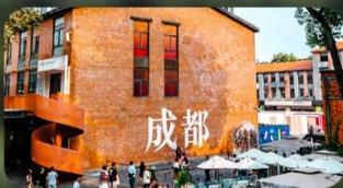
ตงเจียวจี้

HOLIDAY INN EXPRESS HOTEL หรือเทียบเท่า 4 คาว