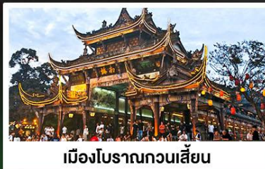
เมืองโบราณกวนเสียน