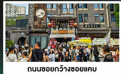
ถนนชอยกว้างชอยแคว