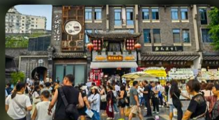
ถนนชอยกวางชอยแคบ