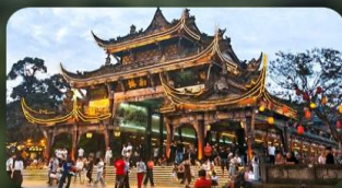
เมืองโบราณกวนเสียน