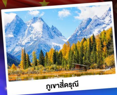
กู๋เขาสีครุณี