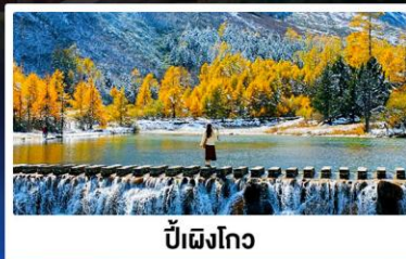
ปี้ผิงโกว