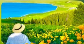
ทะเลสาบไซท์ลี่มู่