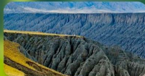
แกรนด์แคนยอนคู่ชานจื่อ