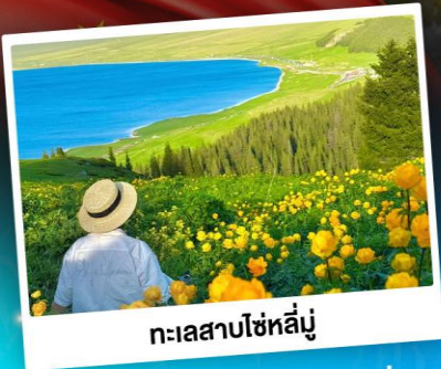
ทะเลสาบไซไห่ลู่