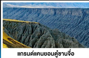
แกรนด์แคนยอนคู่ซานจื่อ