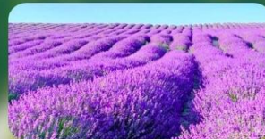
ทุ่งลาเวนเดอร์