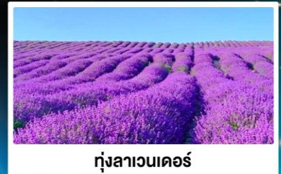
ทุ่งลาเวนเดอร์