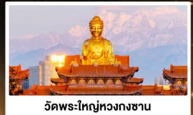
วัดพระใหญ่ทองกงซาน