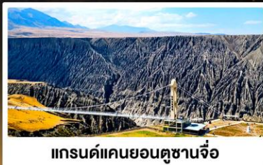
แกรนด์แคนยอนดูชานจื่อ