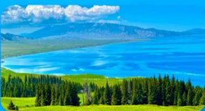
ทะเลสาบไซ่หลี่บู๋