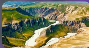
แกรนด์แคนยอนดูซานจื่อ