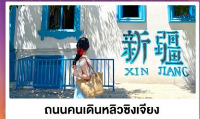
ถนนคนเดินหลิวซิงเจียง