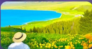
ทะเลสาบไซท์ลี่มู่