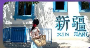
ถนนคนเดินหลิวซิงเจียง