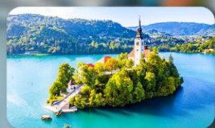
โบสถ์พระแม่มาเรียแห่งเบลค