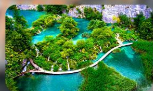
อุทยานแห่งชาติพลิตวิเซ่