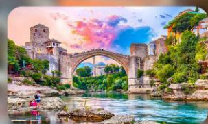
บอสเนียและเฮอร์เซโกวีนา